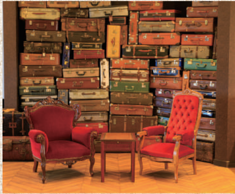
アンティークトランクの前で記念写真をパシャリ！人気のフォトスポット