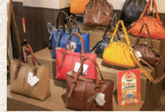
日本で作られた本革バッグの売り場です