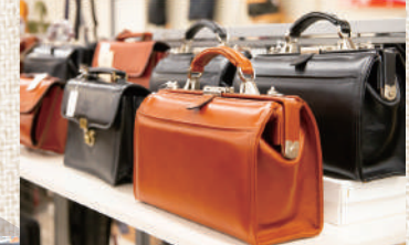
これぞ豊岡の鞆！ダレスバッグ