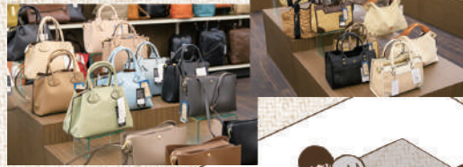
気軽に使えるカジュアルバッグの売場です。かごバッグやファーバッグなどの季節のアイテムも…