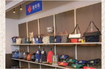
豊岡の地域ブランド「豊岡鞆」の売り場です。