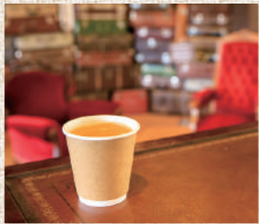
店内にカフェを併設。豊岡市内で焙煎した但馬珈琲を味わいながらゆったりとかばん選びを…