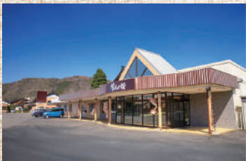
普通車20台・大型バス3台の広い駐車場