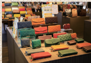
メンズ、レディースどちらも取り扱い